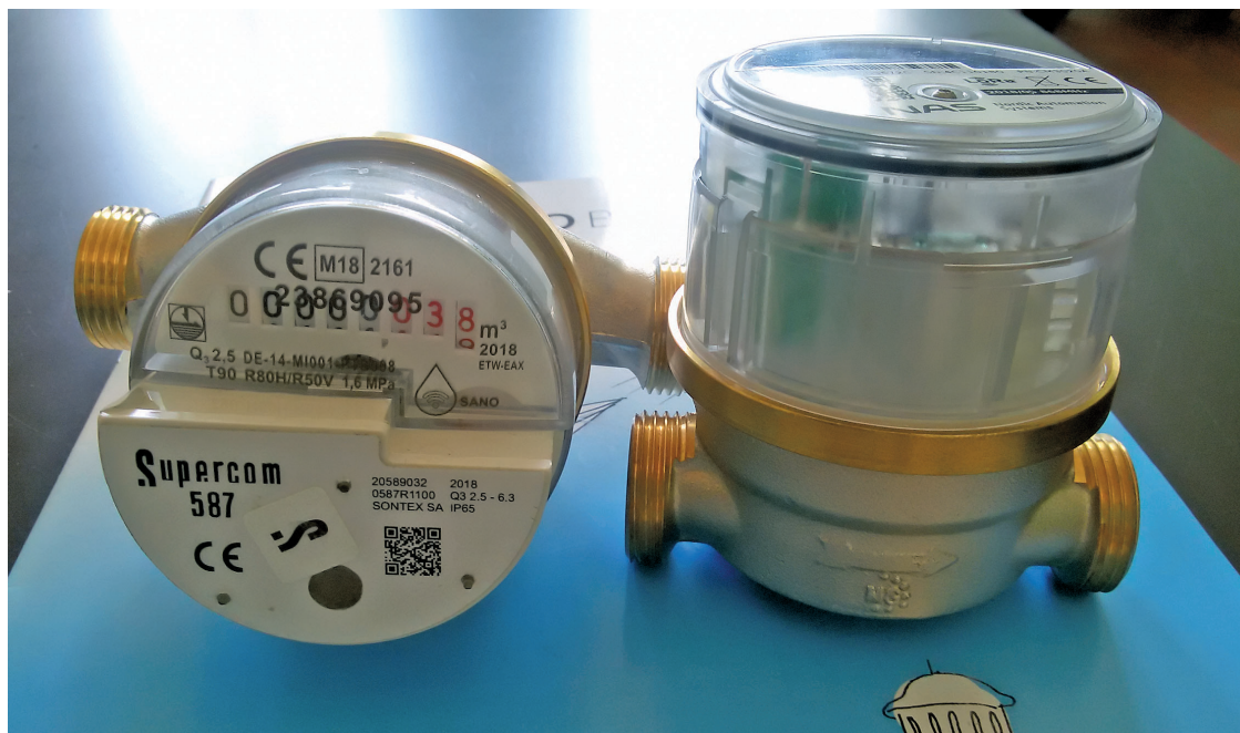
Счетчики Wehrle и все их компоненты производятся в Германии и отличаются высоким качеством.

– Один из модулей дистанционного считывания, которые мы предлагаем, сообщит управляющему даже то, как долго владелец квартиры держал на счетчике магнит. Но магнитить такие